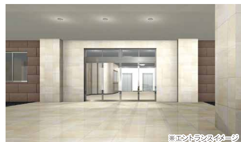
※エントランスイメージ